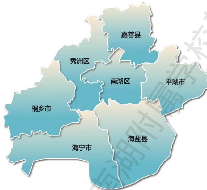
嘉兴市行政区划示意图

对于鸟类区系来说，嘉兴市的鸟类区系组成以古北界鸟类为主；鸟类类群以平原和沼泽湿地鸟类为主，低山丘陵地带带有森林鸟类分布，杭州湾海域及沿海地区亦有少量海鸟分布。嘉兴市位于东亚-澳大利西亚候鸟迁徙通道中部的关键位置，每年会有大量的迁徙候鸟途经作短暂停歇，或在此繁殖或度冬，这些候鸟是嘉兴鸟类大家庭非常重要的组成成分。