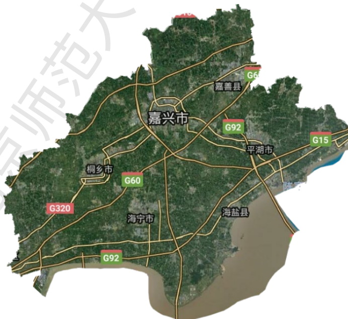
嘉兴市卫星图